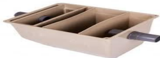
Figure 1 bac à graisse inox sous évier pour cuisine professionnelle

NB : utilisation obligatoire d'un bac à graisse , destiné à séparer la graisse et les éléments solides des eaux usées, afin d'éviter l'obturation du réseau d'évacuation et la formation de mauvaises odeurs,